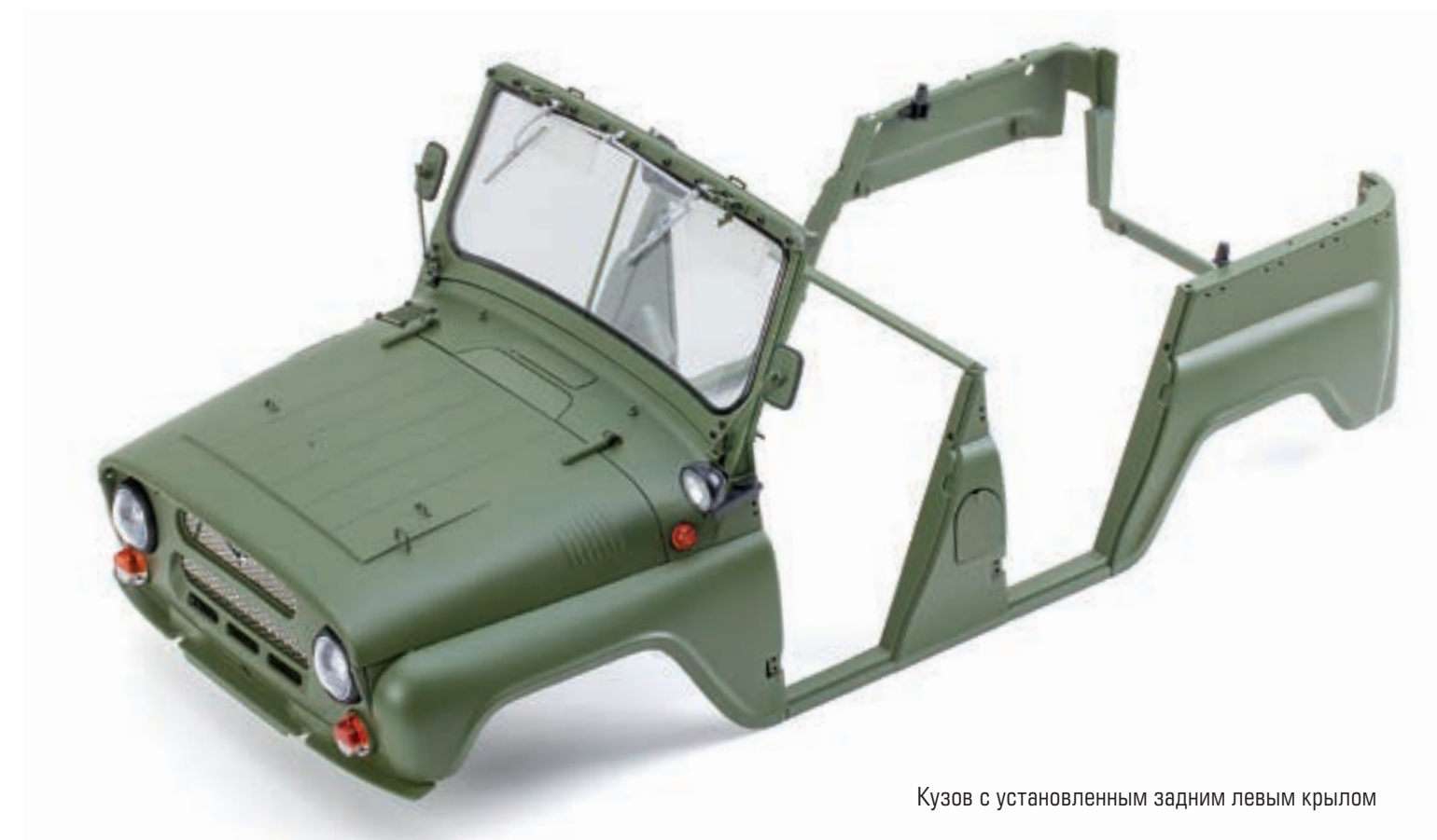
Кузов с установленным задним левым крылом

Шаг 6. Установите запор заднего борта в отверстие заднего левого крыла, расположенное в верхней части возле проема заднего борта. Закрепите деталь винтом 1,5×3 с пресс-шайбой (ТМ) с внутренней стороны каркаса кузова. Рукоять запора капота должна оставаться подвижной.