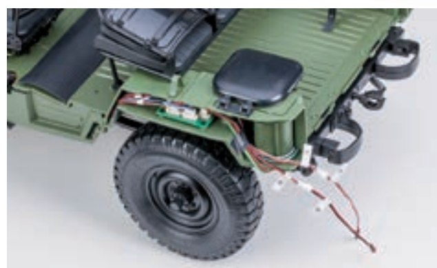
Шаг 1. Отсоедините провода с маркировкой E и G от шасси модели (провода со светодиодами заднего левого фонаря).