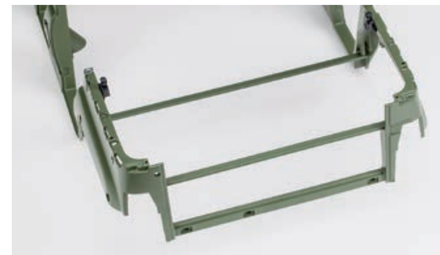
Шаг 3. Удалите перемычки кузова, установленные позади проемов задних дверей и в проеме заднего борта кузова. Снятые перемычки и винты в дальнейшей сборке не понадобятся.